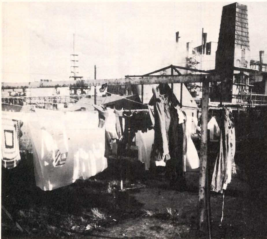
Manipulation des hydrologischen Zyklus: Zusätzliche Verdunstung durch große Kühltürme.

Eine geophysikalische Klimaforschung umfaßt also die datenmäßige Erfassung der klimatologischen Vorgänge, ihre Genese und ihren Ablauf sowie die Entwicklung von Klimamodellen lokaler, regionaler und globaler Skala, womit das „Experiment“ (mit seinen möglicherweise irreversiblen Konsequenzen) von der Natur auf den Rechner verlegt wird. Sie wird besonders die Frage der Instabilität unseres Klimas prüfen müssen, die einige Modellrechnungen ebenso ergeben wie neueste Befunde aus der Klimageschichte.